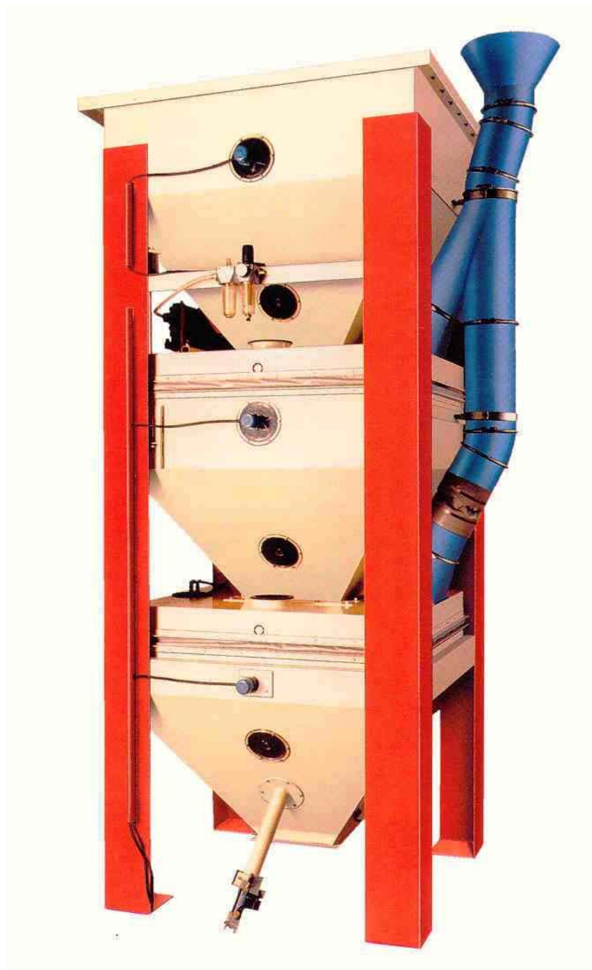
Zur Verwiegung von Schüttgütern